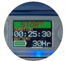
Die farbcodierte Anzeige stellt dar, wie viel Akkulaufzeit Ihnen noch bleibt

Mithilfe der Airwave App auf Ihrem Mobilgerät können Sie mehrere Pumpen überwachen, ohne den jeweiligen Träger zu stören!