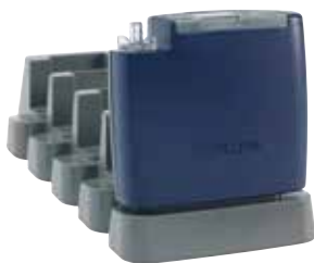
Apex2-Pumpe mit 5-fachem Ladegerät