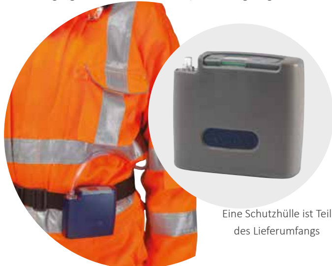
Eine Schutzhülle ist Teil des Lieferumfangs