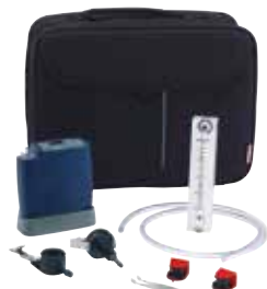
Starterkit steht mit Probenahmezubehör zur Verfügung

Casella UK, Bedford, Vereinigtes Königreich Tel: +44 (0) 1234 844100 Email: info@casellasolutions.com