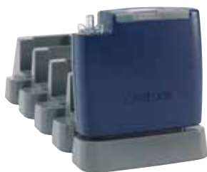
Bomba Apex2 com carregador para 5 unidades