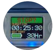
Visor codificado por cores que mostra a duração restante da bateria

Use o Airwave em seu dispositivo móvel para monitorar remotamente várias bombas sem perturbar o usuário!