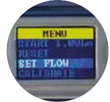
Menu fácil de usar