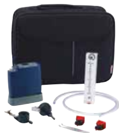
O Kit Iniciante está disponível para incluir acessórios de amostragem