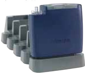
Насос Apex2 с 5-гнездовым зарядным устройством