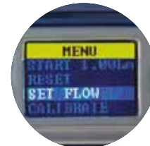
Легкость использования меню