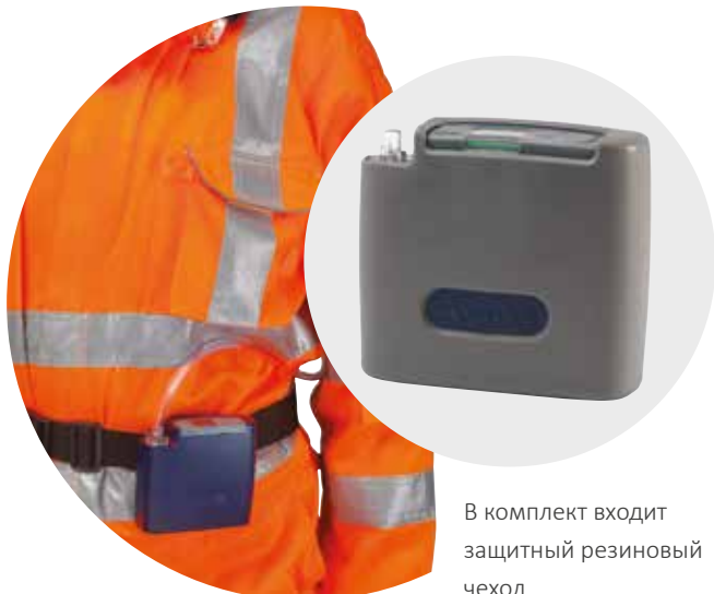
В комплект входит защитный резиновый чехол