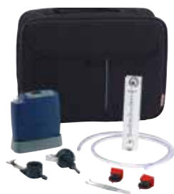
Доступен начальный комплект, который включает принадлежности для отбора образцов