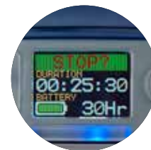
Цветокодированный дисплей, отображающий оставшееся время заряда батареи питания

Используйте приложение Airwave на своем мобильном устройстве для дистанционного контроля работы нескольких насосов, не беспокоя при этом носящего!