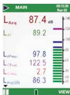
Medição de banda larga

Os parâmetros medidos são mostrados em cores diferentes e os gráficos de barras seguem o mesmo código, facilitando a compreensão da atmosfera de ruídos.