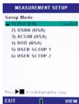
Seleção da configuração