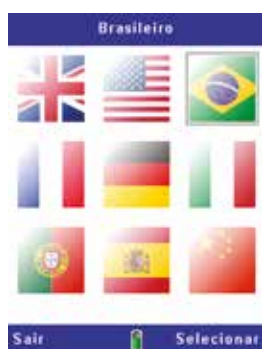
SeInterface de usuário multilíngüe