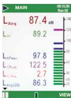
Medição de banda larga

Os parâmetros medidos são mostrados em cores diferentes e os gráficos de barras seguem o mesmo código, facilitando a compreensão da atmosfera de ruídos.