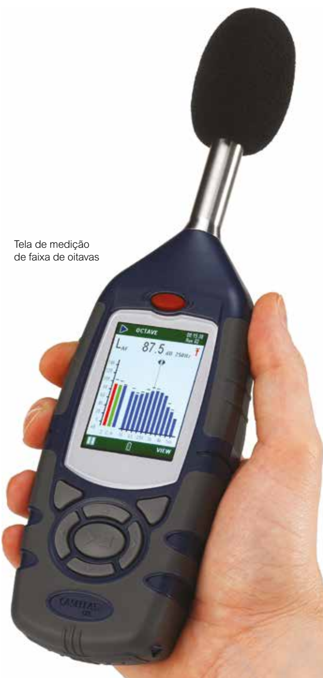
Tela de medição de faixa de oitavas

Há vários modelos disponíveis, dependendo dos seus requisitos de medição de ruídos em geral no local de trabalho, até exigências de higiene industrial completa onde se requer análise de oitavas para a seleção eficaz de proteções auditivas.