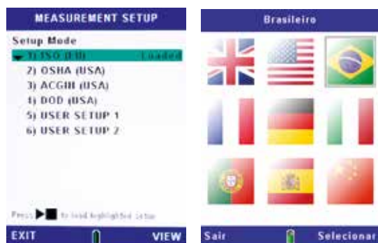
Seleção da configuração